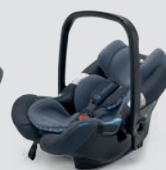
Deep Water Blue